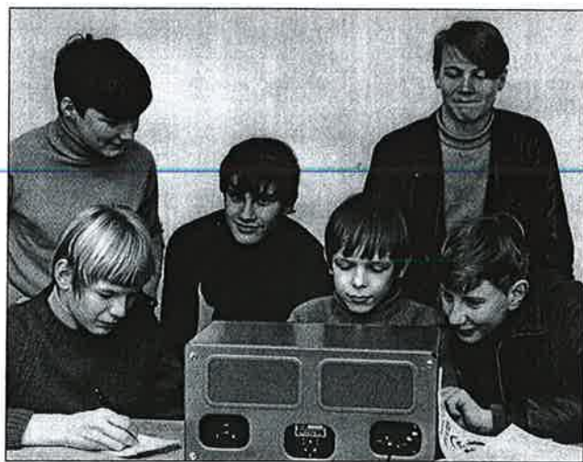
Lyssnarträff med några medlemmar i Burträsk DX-Club på 1960-talet.